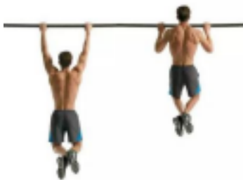
Figura 6. Test flexión de brazos en barra.

Registro: Los valores se tendrán en cuenta según tabla detallada a continuación.