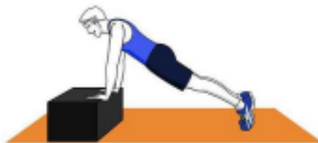
Figura 5. Posición de inicio test extensión de brazos.

POSICIÓN INICIAL. El aspirante se ubicará en el suelo con las manos sobre una superficie elevada (entre 25 y 40 cm de altura), en posición decúbito prono (boca abajo) con las manos separadas al ancho de los hombros, los brazos en total extensión, la cabeza levantada y la espalda recta en el mismo eje de los miembros inferiores, usando las manos como punto de apoyo. FLEXIÓN: Ésta se realizará hasta que el punto en que el esternón realice contacto con el borde del cajón. En ningún momento los codos pueden dejar de rozar la caja torácica. EXTENSIÓN: Se eleva el tronco en bloque, manteniendo la espalda alineada en el mismo eje de los miembros inferiores, realizando una leve flexión en ambos brazos para evitar lesiones articulares por ejercicio repetitivo. En ningún momento se pueden despegar las manos de la base de soporte.