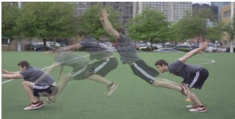
Figura 2. Salto horizontal con impulso de brazos.

Se realizaran dos intentos, considerando para el registro final la mejor marca obtenida.